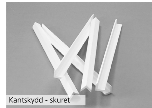
Kantskydd - skuret