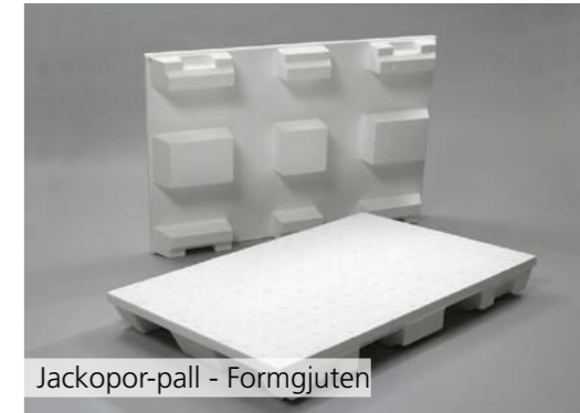
Jackopor-pall - Formgjuten

Jackopor®-pall är idealisk för långdistansfrakt av produkter eller för visningar av produkter i butik. Den är enkel att hantera och har spår för extra stabilitet samtidigt som den är återvinningsbar. Den levereras i olika storlekar, med eller utan folie. Den är godkänd för flygtransport och behöver ingen speciell märkning inom EU. De formstöpta hörnen skyddar möbler och andra varor mot stötar och skador under transport.