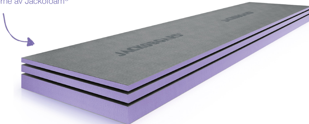
Jackoboard® Våtromsplate Isolerende kjerne av Jackofoam®